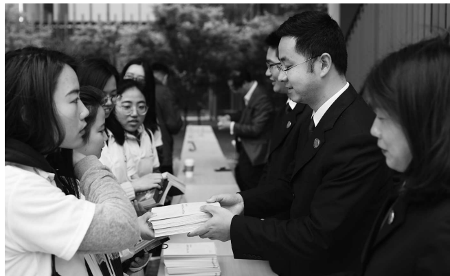
检察官参加国际汽车城创新港知识产权保护咨询会

开宣告了不起诉决定。在案件办理过程中，该院领导及承办检察官曾多次率队赴事发公司调研走访。案件办结后，针对案件中暴露出来的问题，该院制发了检察建议书，给出了详尽的建议。检察建议书指出，该公司园区内有五千余名员工，人车流量大，员工私家车与公司工程测试车并行，部分路段还存在人车混行的情形，加上园区内道路安全警示标志设置不完善，道路标线不清晰，为事故发生埋下隐患。其次，该公司日常对员工常态化的道路交通安全教育培训制度不足，对工程测试车辆的管理措施不规范，是导致事故