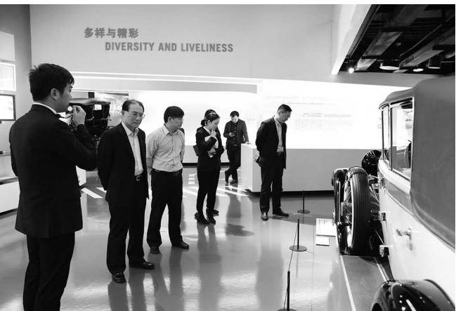
检察长走访汽车企业