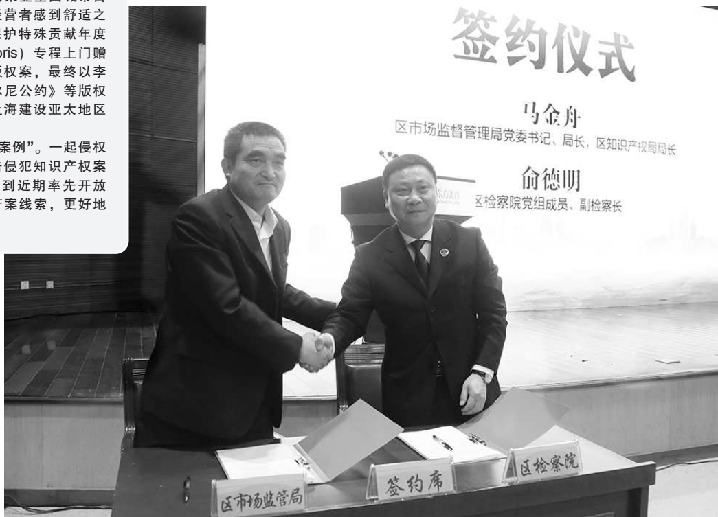
奉贤检方与区市场监管部门联合签署东方美谷知识产权“法网平台”合作协议书

近五年来，奉贤区检察院受理侵犯知识产权案件审查逮捕91件169人，审查起诉91件151人，案件主要以侵犯商标权类为主占94%。随着刑行衔接工作的逐步深入，奉贤检方发现，企业侵权案件线索来源正愈发多元化——随着权利人维权意识的提高，知名企业逐渐累积了丰富的打假经验，权利人举报、购买人提供线索成案的占比较大，分别为34%、12%；公检两