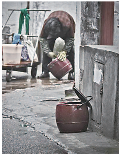
解决拎马桶问题也是旧改重要内容 资料照片

一方面, 本市针对项目清单进一步细化目标任务, 落实工作方案, 加大解决力度, 形成推进跟踪机制, 逐一销项, 推动各区按照因地制宜、分类施策的原则, “多个一点”、多渠道、多途径地解决“马桶”问题, 改善市民居住条件。