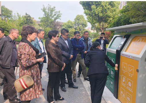
长宁人大常委会组织代表赴芜湖考察学习垃圾分类管理

通过监督调研, 长宁人大常委会针对调研中发现的其他瓶颈问题, 与区委区政府共同努力, 采取措施予以突破。如, 针对行动不便或独居老人如何投放垃圾问题, 部分居委会已采取上门协助投放方式予以解决; 针对农贸市场、标准化菜场就地处理设施如何尽快建成的难题, 区绿化市容部门积极主动对接市级主管部门, 并探索应用了一批湿垃圾处理装置; 部分实行“两定”分类投放的小区, 相继设立误时投放点(应急投放点), 等等。