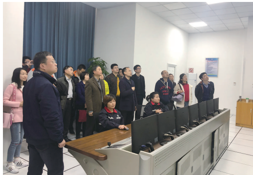
组织代表视察生活垃圾处置末端