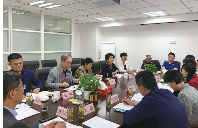
组织听取代表的意见建议

问题和短板, 当好垃圾分类的监督者和推动者。目前, 共通过三个渠道, 开展系列监督调研活动64次, 收到并解决代表意见建议26件。