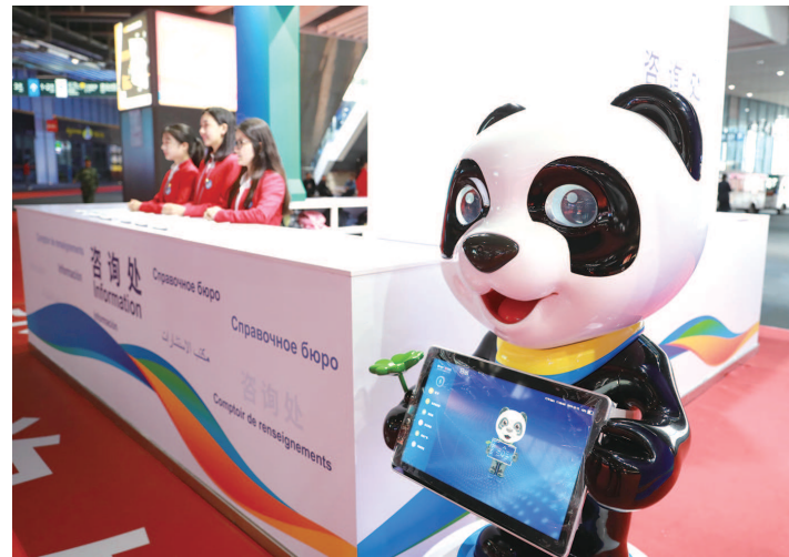
图为咨询服务台为参观者提供服务

市服务保障重点任务为工作场景，按照全流程、全天候、全要素的要求，努力实现“四个检验”“六个确保”的目标。“四个检验”即：检验指挥体系是否运作顺畅、检验方案是否细致周密、检验协调配合是否无缝衔接、检验应急处置是否快速响应。“六个确保”即：确保重大活动圆满成功、确保展会运行高效顺畅、确保工作人员训练有