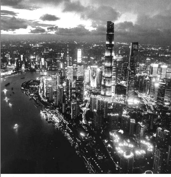
上海夜景璀璨夺目

对比古今粉丝,古贤的拥趸羡慕偶像的才学、成就与人格,现代“粉丝”却偏重于颜值和浮名;前者更彰显文化内涵,后者却凸现浅薄心理。在强调“文化自信”之今日,孰轻孰重、孰是孰非,可谓一目了然!