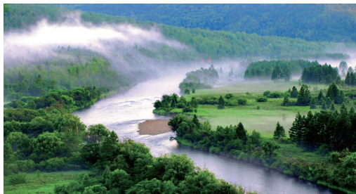
▲ 大兴安岭九曲十八湾国际重要湿地