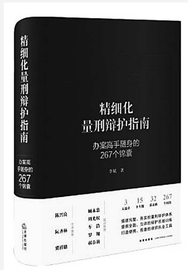
《精细化量刑辩护指南》 李斌 著 法律出版社