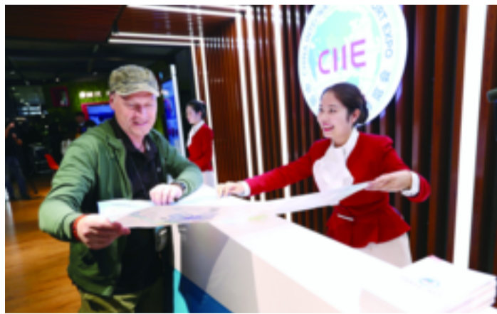
▲同时在启用仪式上亮相的还有进口博览局专门会同上海测绘院设计制作的《中国国际进口博览会导览图》