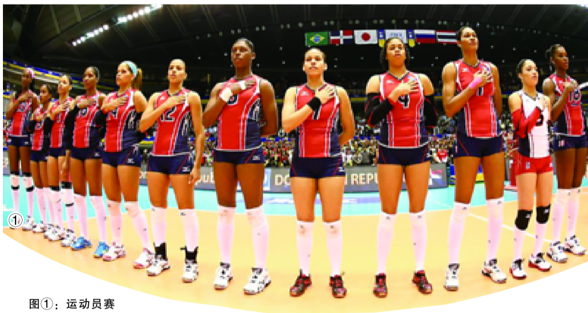
图①：运动员赛前向国歌致敬

巴西宪法规定，国歌是国家的四大象征之一，奏唱国歌时，人们需要起身肃立，有庄重感，即便以表达尊重为出发点也不得做无关的手势或动作，男性需要脱帽，军人行军礼。巴西国歌成型于1822年，为帝国乐队琴师为庆祝国王佩德罗一世宣布巴西脱离葡萄牙独立而作。随着巴西从君主制过渡到共和制，歌词不停变换，出现很多版本，直到1922年，才由时任总统签署法令，确定把诗人埃斯特拉达填写的版本当作国歌歌词，其内容是歌颂自由平等、祝愿祖国昌盛。1971年巴西政府出台了正式法律，再度明确国歌版本，规定现场演奏必须由管弦乐队完成，采用F大调。巴西国歌长达4分28秒，同样的旋律重复两遍，但两段歌词不同，所以法律还特别提到乐队必须完整演奏，而若配有歌唱者则必须演唱歌词的两个段落，而重大场合乐队演奏时，则不可以配有现场歌伴唱。