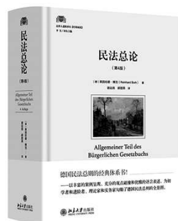
【德】莱因哈德·博克 著 谢远扬 郝丽燕 译 北京大学出版社

《民法总论(第4版)》的内容按照传统的民法总则教科书的顺序展开。首先，讨论了民法的基本理论，即私法和权利理论，包括私法的秩序、权利主体等。其次，详细论述了民法总则部分的核心内容，即法律行为理论。最后讨论了法律行为的特殊行使行为，以及新时代民法的发展，包括代理、同意和消费者保护制度。