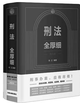
冯江 编著 中国法制出版社

本书详细标注《刑法》条文历次修改情况，及罪名和立案标准、量刑标准的变化情况；收录刑事立法与司法解释、涉刑司法性文件、法答网精选问答、检答网集萃等；收录最高人民法院、最高人民检察院发布的指导性案例、案例库案例；对现行有效的数百件司法文件进行了仔细辨析，甄别其实际法律效力。