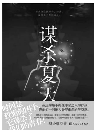
《谋杀夏天》 赵小赵 著 人民文学出版社

那是一个再普通不过的高考后的夏日，正如“永远有人十七岁”一样热烈、充满希冀，而就是这样的夏日午后，在湘江造纸厂防空洞内，备受厂内子弟学校学生爱戴的孟海老师却意外遇害，血溅防空洞。校内乐队“萤火虫”是受孟海老师鼓舞建立起来的，然而乐队的五名成员均卷入了这起离奇的枪击案。自此，萤火虫迷路，情愫暗藏，真相蛰伏，命运晦暗不明。