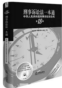
刘志伟 魏昌东 吴江 编 法律出版社

《刑事诉讼法一本通》在体例上采用以法典为中心分散列举的模式，形成了以法典为主干，以相关解释为注脚的编辑体例，自2005年出版以来受到广泛欢迎与好评，成为口碑享誉市场的畅销法律工具书。本次第18版新版修订及时更新了2023年9月至今的司法解释并增添了相关指导性案例。