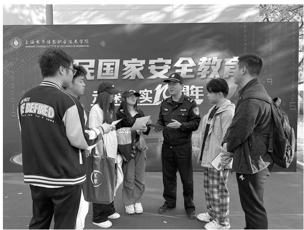
记者 沈媛 通讯员 王瑛威

本报讯 昨天是第十个全民国家安全教育日，金山公安分局民警走进社区、学校、商圈，组织开展形式多样的宣传教育活动。在上海电子信息职业技术学院，民警为学生们带来了一堂生动的“网络安全宣讲”，结合真实案例，深入剖析新型网络安全风险，为学生们送上个人信息安全防护指南，帮助学生提升防范网络风险的能力。