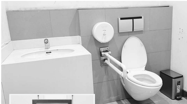
▲无障碍厕所内的 U 型抓杆和洗手台设置尚不完善 ◀目前该厕所已暂停使用，正在进行改造