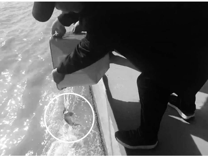
民警将野生中华鲟放回长江

垂钓爱好者没来得及开钓，却第一时间在内河浅水区救起一条国家一级保护动物——中华鲟。昨天，上海市公安局崇明分局新河派出所接群众求助后，及时配合相关部门将一条健康的幼年中华鲟放归长江生活。