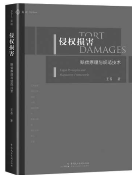
王磊 著 中国民主法制出版社

行为致害，何时应予赔偿以及赔偿范围与数额问题，是民法中侵权法的核心论题。本书意图从基本原理的探究与规范技术的构建两个层面去厘清侵权损害赔偿法的实貌。本书融方法论于具体问题研究之中，对侵权损害赔偿法的体系构造进行了再形塑，从赔偿原理到规范技术形成了健全的侵权损害赔偿本土知识系谱，促进了判例与学说的良性互动，为侵权法基本问题的解决提供了新的视角。