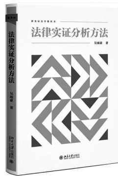
吴雨豪 著 北京大学出版社

本书以详实资料为基础，采取精准描述的手法，对法律实证分析方法作了深入浅出的介绍与评述，为读者呈现了法律实证分析方法的全貌。尤其应当指出的是，本书作者具有刑法教义学和犯罪学的双重知识背景，因而更能够在法教义学方法和法律实证方法的双重关照下，深刻把握实证分析方法在部门法中的实际运用。