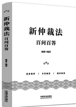
杨赟 编著 中国法治出版社

《中华人民共和国仲裁法》（以下简称仲裁法）自2026年3月1日起施行。新修订的仲裁法对于健全完善具有中国特色、与国际通行规则相融通的仲裁法律制度，更好地服务高质量发展和高水平对外开放具有重要意义。本书逐条对新仲裁法的条文进行解析，集问题导向、专家解读与案例评析于一体，是读者深入理解与准确适用新仲裁法的必读工具书。