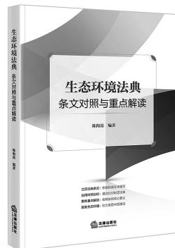
陈海嵩 编著 法律出版社

本书作者全程参与全国人大常委会法工委“生态环境法典编纂专班”工作，知晓每一条规定的来龙去脉，同时能够迅速把握条文的重点，为进一步的理解适用奠定基础。本书详细列出生态环境法典的立法依据，全面解读法典的编纂背景、总体结构与制度创新，逐条解析条文及其适用，帮助读者精准把握条文含义与适用要点。