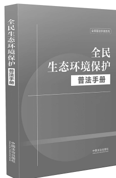
中国法治出版社 编 中国法治出版社

本书围绕《生态环境法典》编纂体系，分为四大板块。污染防治板块收录并汇编排污许可、生活垃圾等相关法律法规；生态保护板块收录并汇编山水林田湖草沙保护等相关法律法规；绿色低碳发展板块收录法典绿色低碳发展编以及循环经济、可再生能源等相关法律法规；法律责任板块明确环境相关的民事、行政、刑事责任。