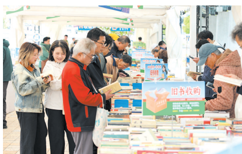
▲ 苏州河樱花谷驿站的旧书市集