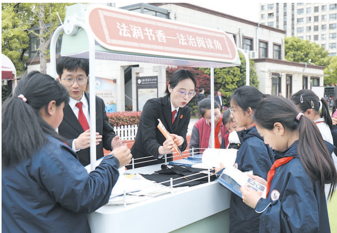
▲ 静安法院在彭浦第四中学设置的“法治阅读角”