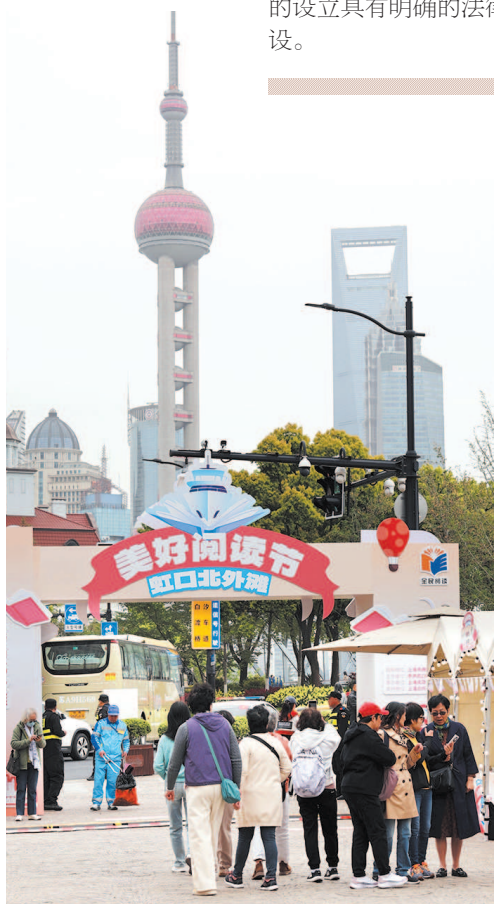
▲ 虹口北外滩的美好阅读节活动